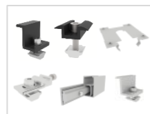
SET A2 PV-Montage für 4 Panels, 30mm Rahmenstärke, Schwarz