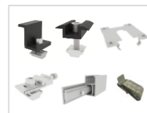
SET A4 PV-Montage für 4 Panels, 35mm Rahmenstärke, Schwarz