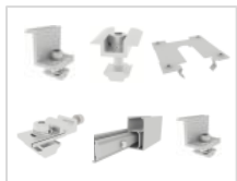
SET A1 PV-Montage für 4 Panels, 30mm Rahmenstärke, Silber