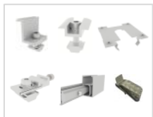
SET A3 PV-Montage für 4 Panels, 35mm Rahmenstärke, Silber