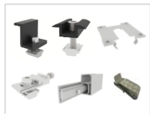
SET A2 PV-Montage für 4 Panels, 30mm Rahmenstärke, Schwarz